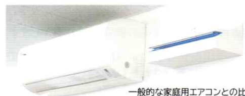
一般的な家庭用エアコンとの比較